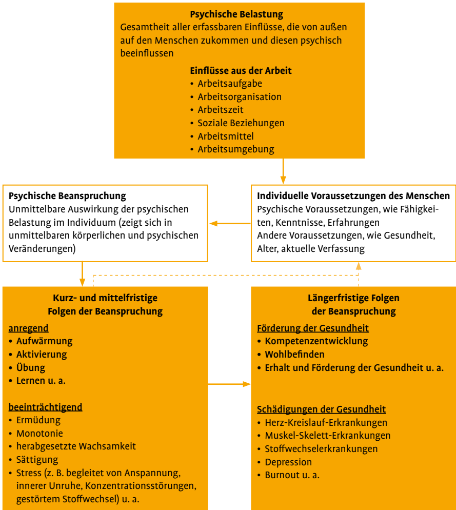
Abbildung 1: Psychische Belastung, Beanspruchung und Beanspruchungsfolgen